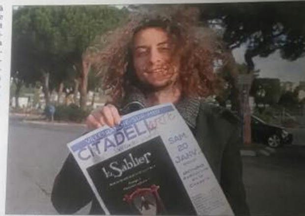
Un « seul en scène » émouvant, drôle sur l'insouciance de l'enfance qui s'en va...

J'ai 23 ans, un âge pivot, une transition entre la fin de l'adolescence et la confrontation au monde réel. Ce "seul en scène" rend hommage à l'insouciance de la jeunesse qui s'éloigne lorsque l'on grandit mais qu'on veut malgré tout